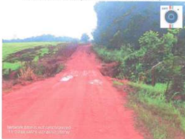
Imagem não é rotacionada 11/03/2024 09:54:00

COORDENADAS UTM : 742323.00 m E 8728117.00 m S